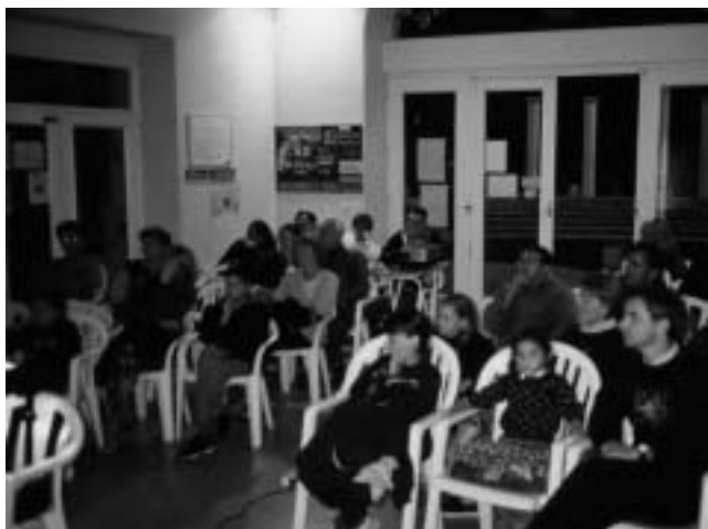
Une animation à Saint-Nectaire

Le choix employé en France, comme en Auvergne, est de privilégier une découverte hors des gîtes par différents outils.