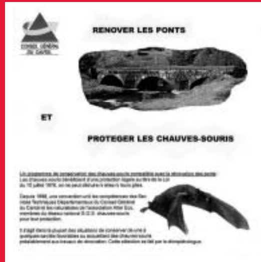
Plaquette technique STD 15

Il s'agit d'un mémento à destination des entreprises, des correspondants ouvrages d'art... Editée courant de l'année 2000, elle est la référence pour expliquer concrètement les procédés de rénovation pro-chiros. Il est demandé par les partenaires qu'elle soit mise à la disposition des entreprises à chaque chantier et que celles-ci l'affichent dans leurs locaux temporaires.