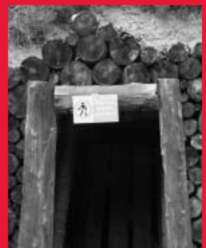
3 - Il n'est pas pris en compte le travail bénévole réalisé par l'association La Route des Mines (nettoyage du sentier, entretien, balisage).