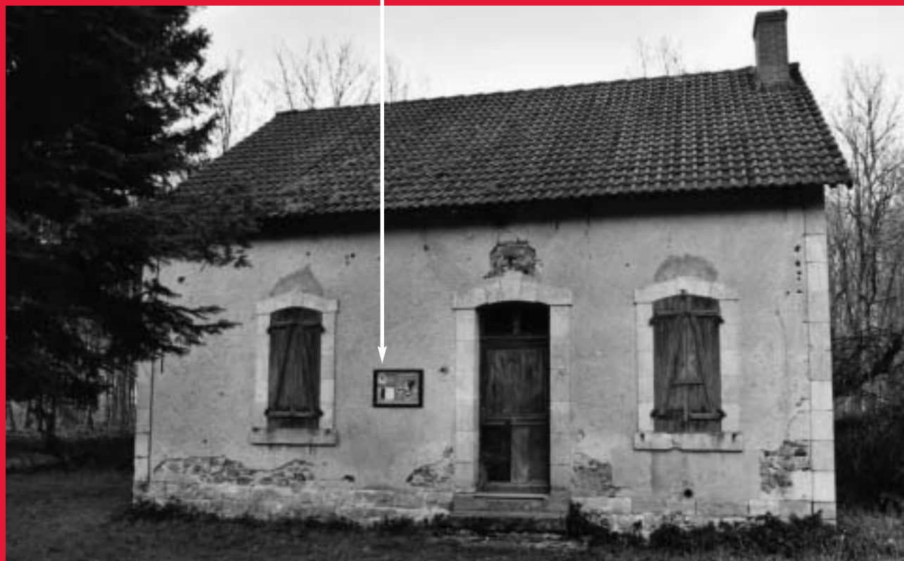
Panneau installé sur une maison forestière

Deux maisons forestières sans utilité particulière et régulièrement fracturées ont fait l'objet d'un aménagement "chiroptères", les objectifs étant de limiter le vandalisme et de favoriser un gîte potentiel pour des chauves-souris. Suivies depuis dix ans par Chauve-souris Auvergne, une seule est fréquentée par plusieurs espèces (Pipistrelles de Kuhl et commune, Barbastelle, Sérotine commune et Murin de Bechstein). Les travaux de fermeture ont été réalisés en hiver 2005. Un panneau d'information a été installé au niveau de chaque porte : une double démarche de protection et de sensibilisation.