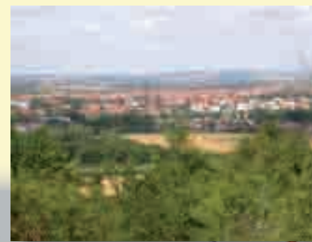
Panorama sur Riom