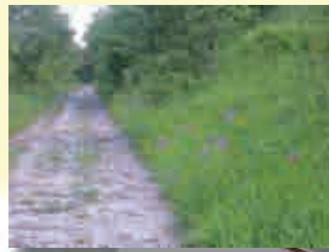
Floraison des orchidées en mai