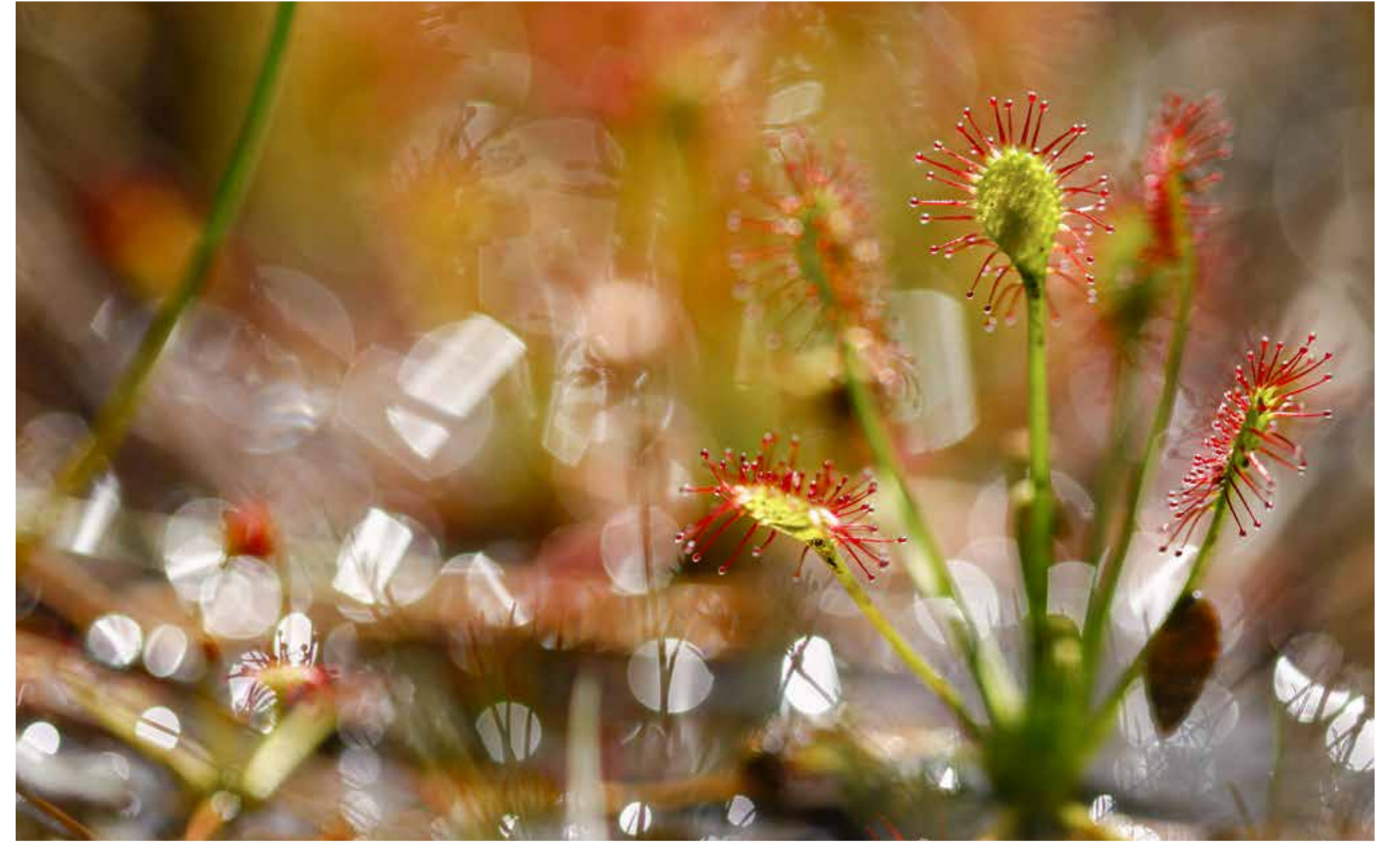
Drosera à feuilles intermédiaires se développant dans les zones humides oligotrophes