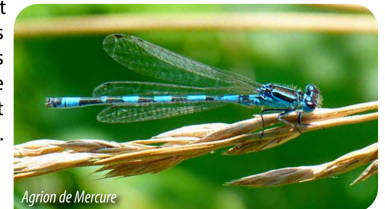
Agrion de Mercure

Le caractère remarquable du site ne doit cependant pas occulter les fortes menaces exercées sur les milieux naturels. De nombreuses zones humides présentent un fonctionnement hydrologique altéré, lié à des dégradations localisées au sein du périmètre Natura 2000 mais également sur la partie amont du bassin. Des pratiques agricoles inadaptées impactent également l'état de conservation du site, qui est globalement moyen à mauvais.