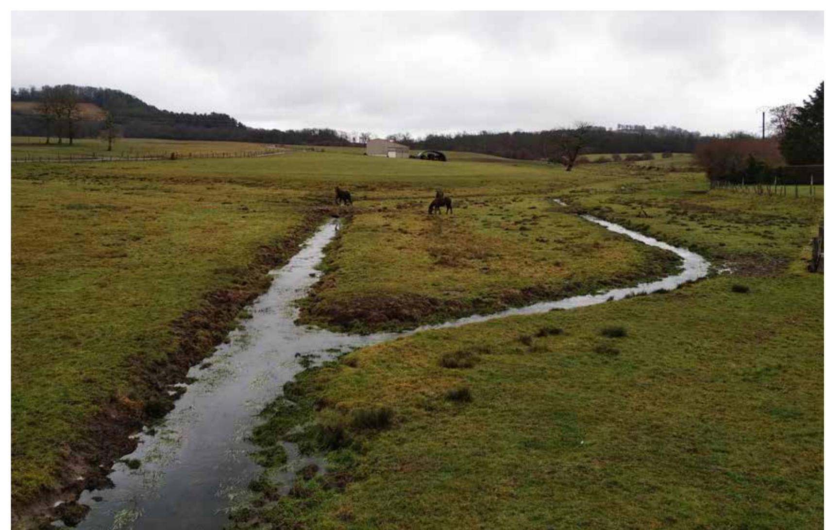
Écoulement rectifié et pâturage hivernal sur zone humide en amont du site