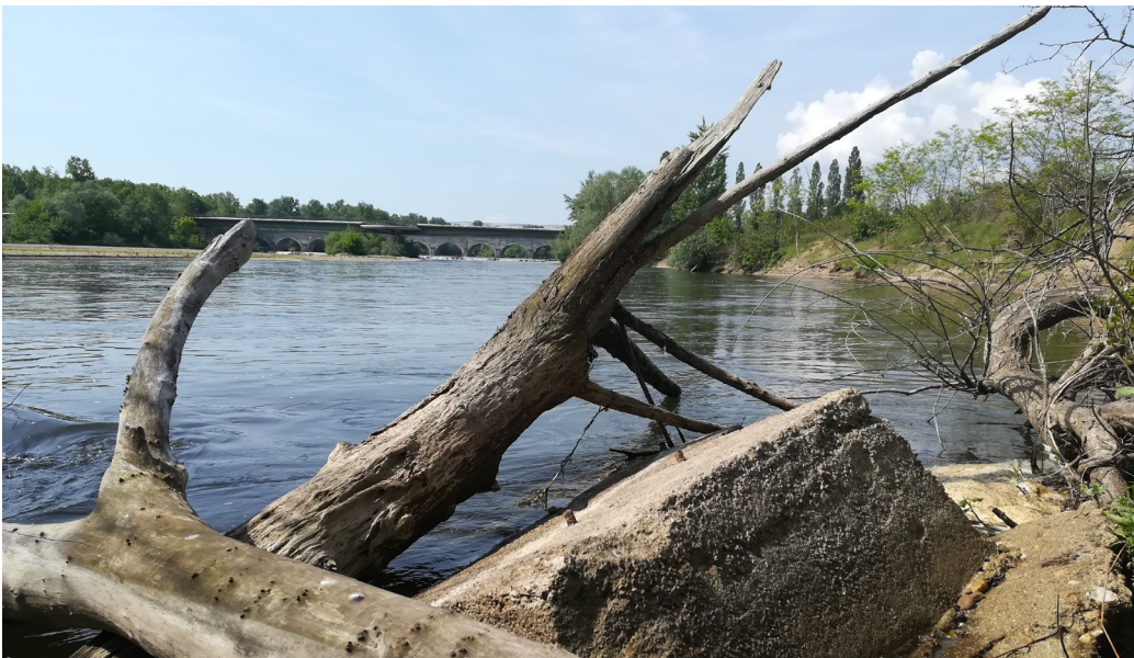
Protection de berge obsolète sur l'Allier à Gimouille (18)