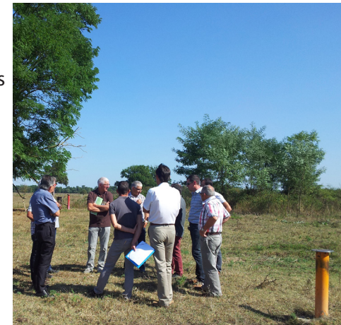
Visite avec le SIAEP de Basse Limagne et la SEMERAP sur le Val de Loire