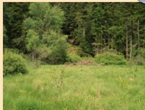
Cinq propriétaires forestiers se sont engagés dans une gestion durable de leurs zones humides.