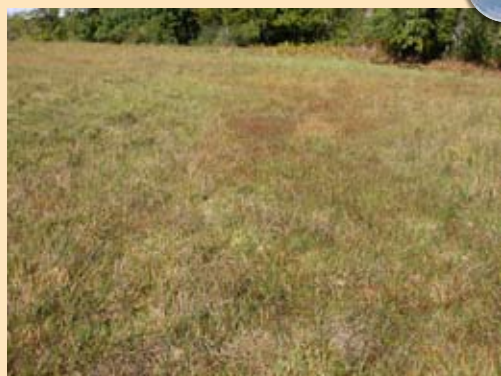
Un des derniers adhérents agriculteurs se trouve sur la commune de Siran. 10 autres agriculteurs sont également membres du réseau au 31/12/11.