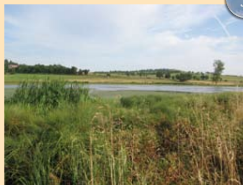
La commune de Talizat a adhéré à la charte de bonnes pratiques pour la narse de Pierrefitte, zone humide emblématique de la Planèze de Saint-Flour, notamment pour l'avifaune (migration et nidification). Une autre collectivité a adhéré dans le Puy-de-Dôme, ainsi que le Ministère de la défense sur le camp militaire de Bourg-Lastic.