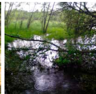
Une des rares zones humides du massif des côtes se trouve sur la commune de Blanzat (lac Saint Cassy).