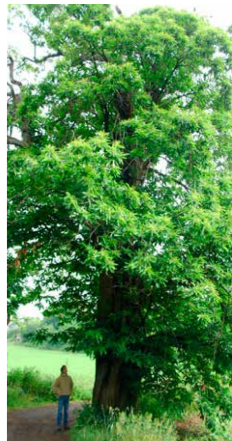
Quelques vieux châtaigniers, ici sur le plateau de la Bade : un patrimoine fruitier et un habitat pour de nombreuses espèces.