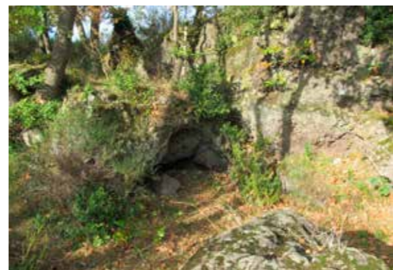
Le plateau de la Bade, formé d'une ancienne coulée de basalte, offre en plusieurs endroits des grottes sous coulées ou formées par d'anciennes bulles d'air dans la coulée, constituant une curiosité géologique dans ce secteur.

Un travail de synthèse des données existantes a été effectué en compilant les données présentes au CEN Auvergne, éventuellement réorganisées et restructurées, les données publiques de la DREAL et de Clermont Auvergne Métropole, les données bibliographiques, les données disponibles sur le serveur du CRAIG, les données de partenaires techniques (LPO, UNIVEGE, Observatoire de la biodiversité métropolitaine, etc.)