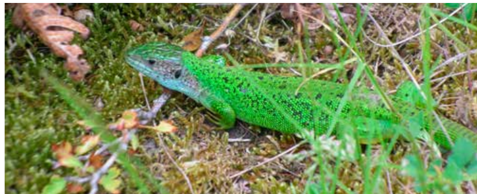
Le Lézard vert ou à deux raies aime les broussailles et rochers de la Bade et des Côtes.